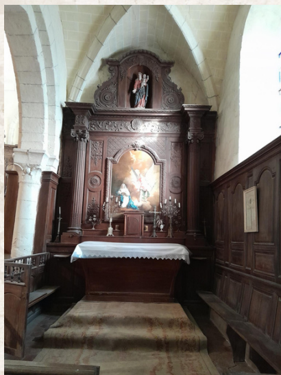
Chapelle de la Vierge

En 1844, le baron des Etards, alors propriétaire du château, fit restaurer la chapelle Sainte-Adélaïde. Ensuite, le conseil municipal autorisa à faire boucher la porte de ladite chapelle et à rouvrir une fenêtre donnant sur le presbytère.