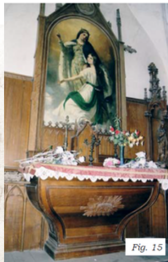
Chapelle de la Sainte-Adélaïde