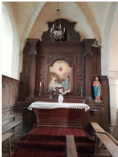
Chapelle de la Sainte-Trinité