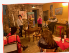
Afterworks avec France Active : présentations de projets de tiers-lieux en Essonne