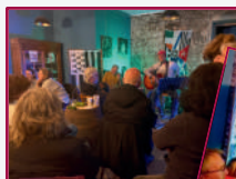
Concert de B'Art Bellamure