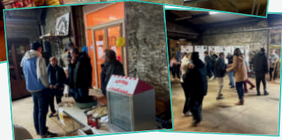
Soirée téléthon en partenariat avec les associations ABELS, “La forêt en fête” et “Traces de pas”