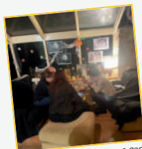
Soirée jeux spéciale escape game en partenariat avec ABELS