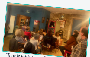
“Tous le 6 à la Forge: “contes et chocolats” en partenariat avec la bibliothèque