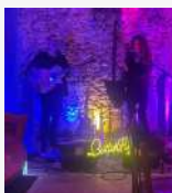
21/03 Les Butterflies