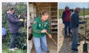
Chant participatif du 15/03