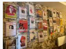
"Tous les 6 à la Forge" du 6/3... femmes à l'honneur