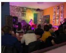
Concert 07/03 les Nanas Crouze